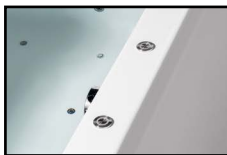
HYDRO POOL, HYDRO LUX, TURBOAIR + COOLIGHT SLIM

Osvětlení spustíte stisknutím tlačítka. Dalším stiskem tlačítka osvětlení vypnete.