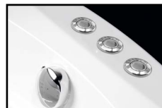
KOMBI POOL, KOMBI LUX + COOLIGHT SLIM