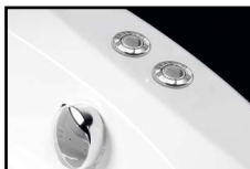
HYDRO POOL, HYDRO LUX, TURBOAIR + COOLIGHT SLIM

Osvětlení spustíte stisknutím tlačítka. Dalším stiskem tlačítka osvětlení vypnete.